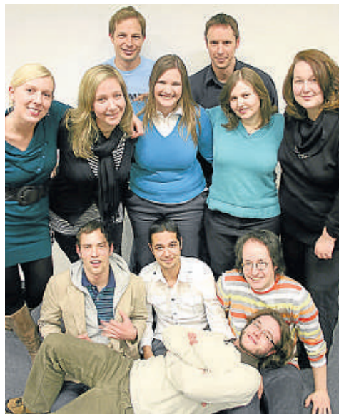
■ Die Lindentheaterler suchen mit einem Casting Verstärkung, sowohl auf als auch abseits der Bühne.

noch Verstärkung im Alter von 20 bis 35 Jahren, die ab August mit Spaß am Theaterspiel und am karnevalistischen Treiben die Truppe unterstützen möchte - ganz egal, ob auf oder abseits der Bühne. Aus diesem Grund laden die Lindentheaterler am 21. Juli ab 19 Uhr zu einem Casting ins Colonus Carré (Subbelrather Straße 15) ein. Vorab ist hierfür eine Anmeldung per Mail an die Adresse lindentheatercasting@gmx.de erforderlich. Weitere Informationen sind online unter www.lindentheatler.de zu finden.