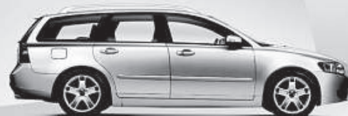
ABB. ZEIGT SONDERAUSSTATTUNG. KRAFTSTOFFVERBRAUCH (IN l/100KM) MESSVERFAHREN RL 80/ 1268/EWG. VOLVO V50 D2 84 kW (115 PS): 5,2 INNERORTS, 3,8 AUSSERORTS, 4,3 KOMBINIERT, CO2-EMISSIONEN: 114 G/KM KOMBINIERT.

ES GIBT MEHR IM LEBEN ALS EINEN VOLVO. DESHALB FAHREN SIE EINEN.