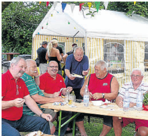
■ Viel Spaß hatten die Kleingärtner in Lindenthal bei ihrem Sommerfest.

Mo.-Fr. 9.30-19.30 Uhr durchgehend Sa. 9.00-18.00 Uhr durchgehend